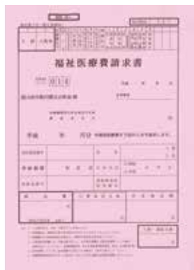
福祉医療費請求書（ピンクの紙）▶