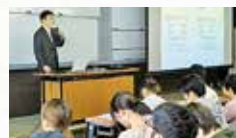
富山大で講義(2017年7月)