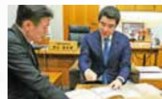
野上浩太郎内閣官房副長官に要望@総理官邸