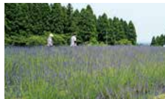
▲グリーンパーク吉峰のラベンダー畑

立山町のラベンダーなどの農林産物を原料とした化粧品など、アロマ工房やエステサロン、レストランなどの美容・健康リゾートが2019年4月オープンを目指して計画されています。このほかに6次産業化の構想もあり、引き続き、支援してまいります。もちろん、農業の担い手がいなければ、このプロジェクトは成功しません。農業用水路改修などの農業基盤の整備や6次産業化による所得の向上を図ります。