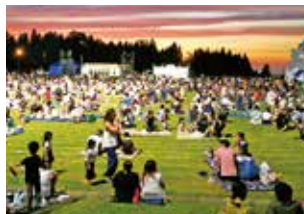
▲立山ドンドンまつり2017