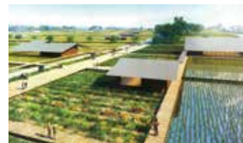
▲立山プロジェクト完成予想図