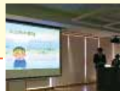
インターカレッジコンペティション